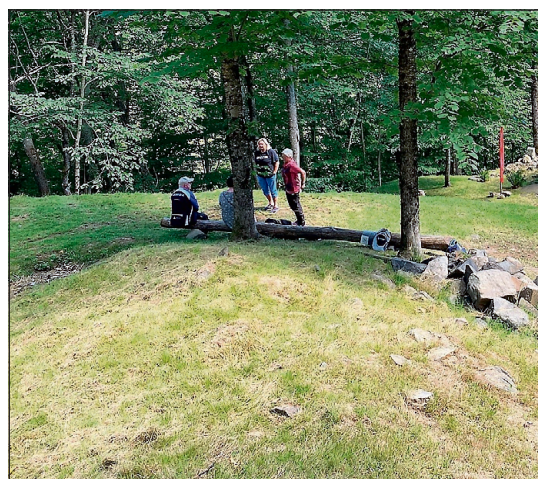
IDYLL: Det har blitt jobbet hardt i generasjoner på Melaaslia.