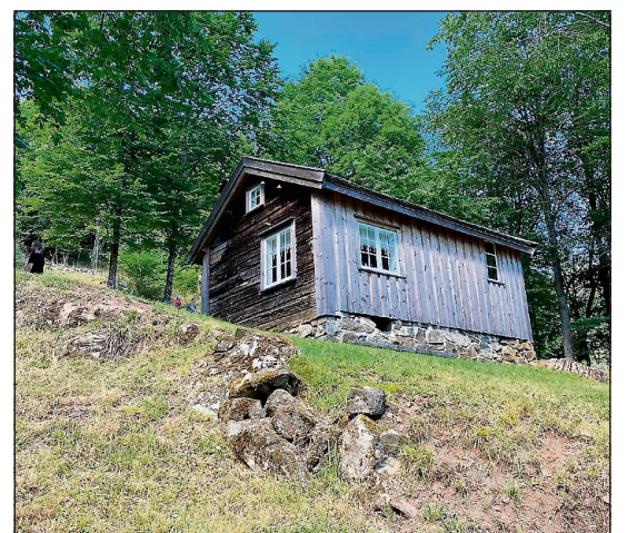
BRATT: Det er bratt opp til Melaaslia