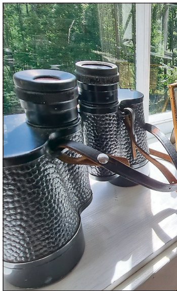
VINDUSKARMEN: Kikkerten står klar i vinduskarmen på Melaaslia.

Husmannsplasser generelt bestod av kortreiste og billige materialer og gjerne av et uthus og ei lita stue. Husmann kom som en konsekvens av befolkningsveksten fra 1600-tallet og vokste betydelig mer som følge av odelsretten på begynnelsen av 1800-tallet. De startet ofte som tjenere og endte som fattiglemmer. De bodde ofte i familier og leide husmannsplass av en gårdbruker. Leien ble betalt med pliktarbeid, noe som også kunne omfatte husmannskona.