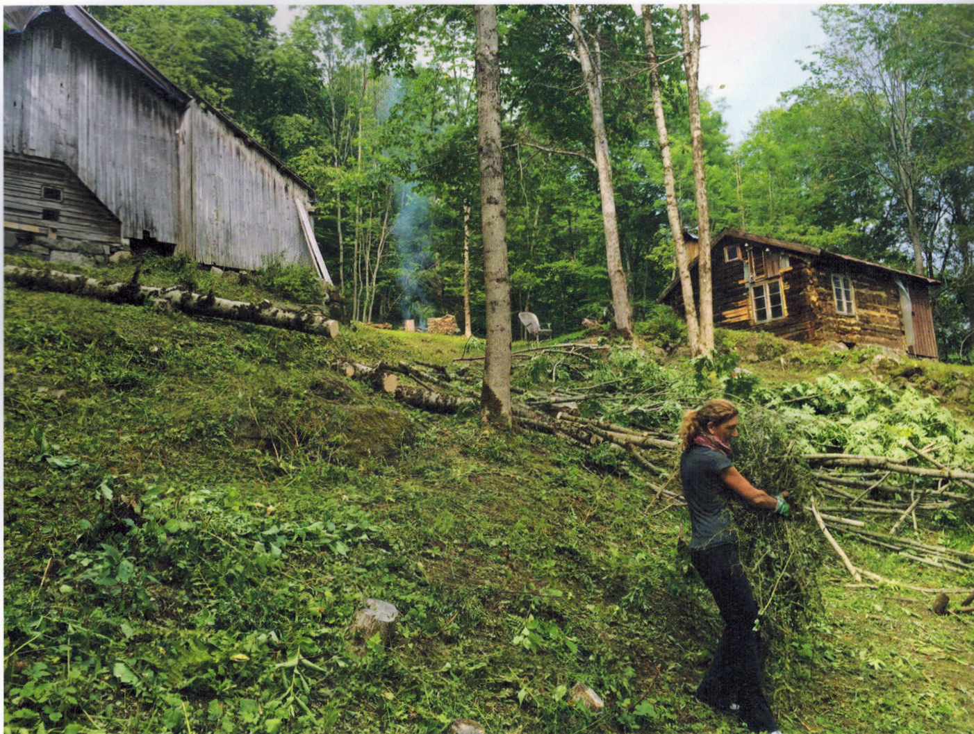
Slåttonn i Lia, august 2015.