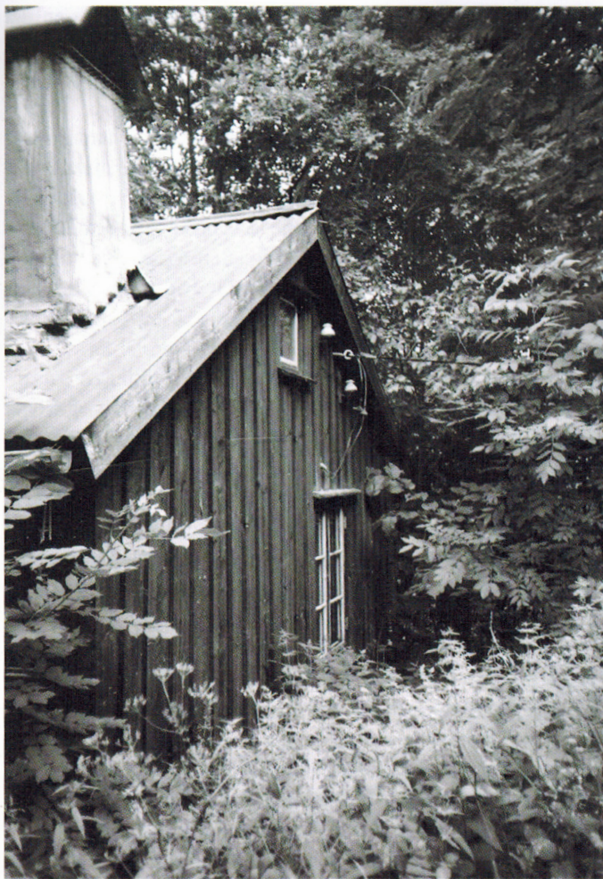
Lia før overtakelsen. Plassen ligger fint til med utsikt over deler av Gjerstadbygda.

Kilder: Artikkelen er satt sammen med bidrag fra blant andre Einar Engen i Norsk Kulturminnefond, Arvid Sollie, Wikipedia og www.husmannsplassen.com .