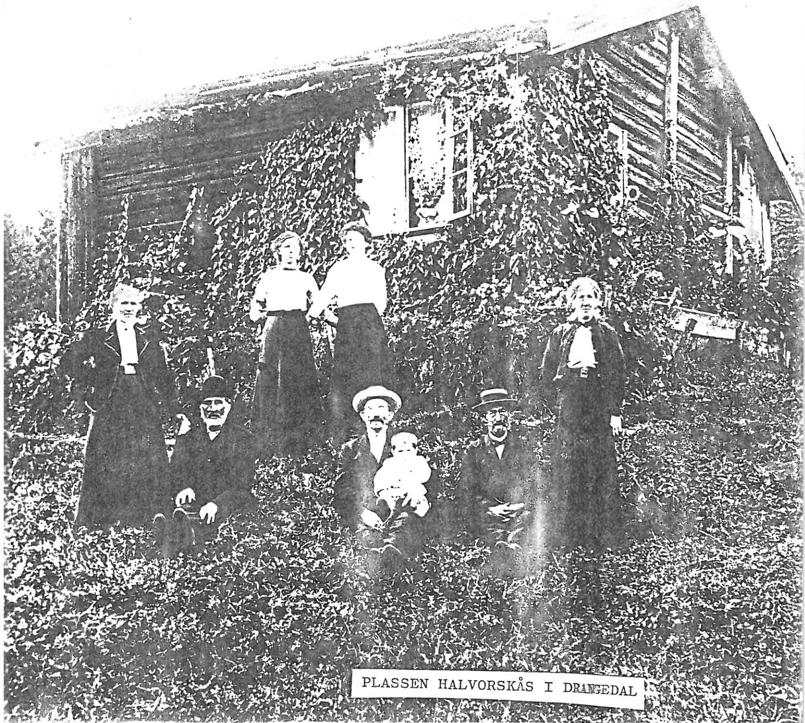
PLASSEN HALVORSKÅS I DRANGEDAL